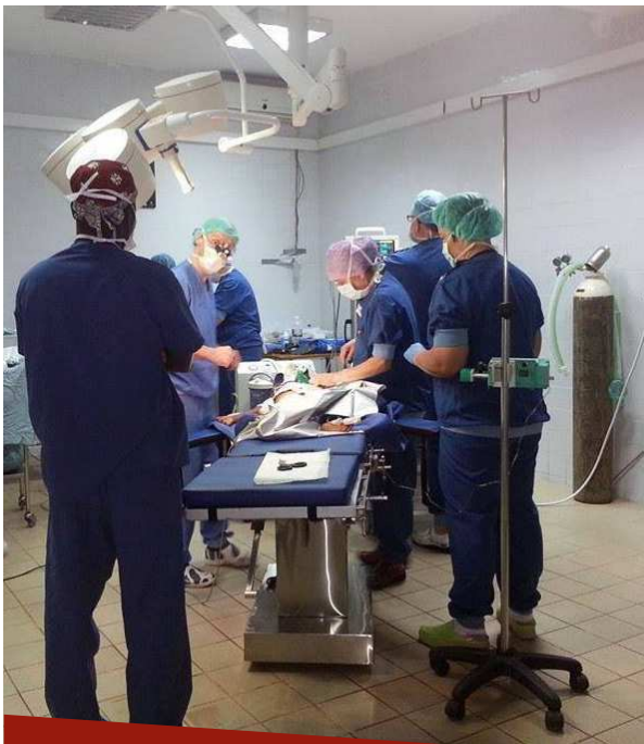
Opereren in het Serrekunda Hospital